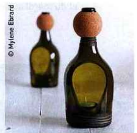
Lanterne photophore Nino